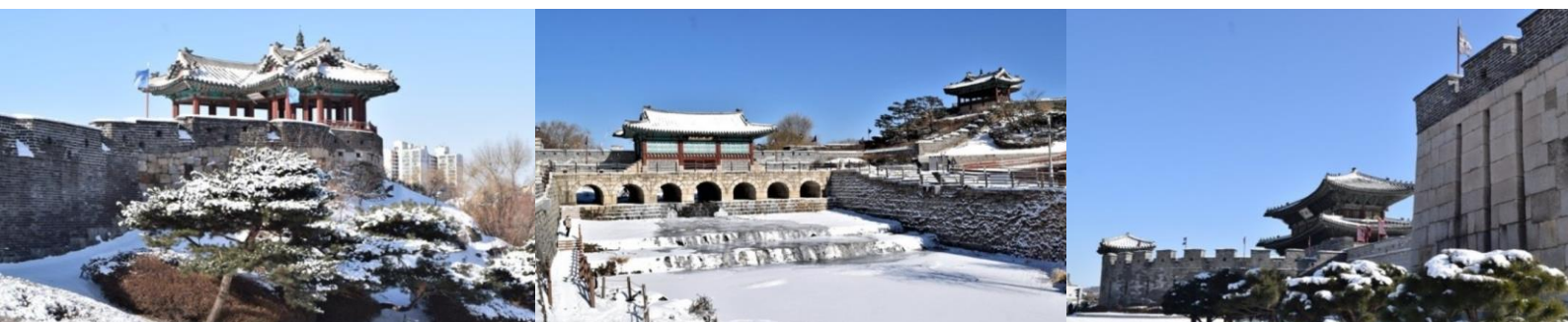
เพิ่มคุณค่าการเดินทาง รวมเดินทางเบกเบร " การเดินทาง " ของคุณ จะสุขสนุกกว่าที่เคย กับผู้ชำนาญกว่า 19 ปี

ป้อมปราการชวอนฮวาของ (ป้อมดอกไม้ม) ได้รับการขึ้นทะเบียนเป็นมรดกโลกทางวัฒนธรรมขององค์การยูเนสโก UNESCO เมื่อปี ค.ศ. 1997 จากการใช้วิทยาการการก่อสร้างระหว่างวิธีของชาวตะวันตก และ วิธีของชาวตะวันออกผสมผสานเข้าด้วยกัน มีการใช้บันไดขั้นเป็นครั้งแรกในการก่อสร้าง ซึ่งถือว่าทันสมัยสุดๆ ในยุคนั้น ป้อมมรดกโลกฮวาของที่สง่างามและมีอายุมากกว่า 200 ปี ย้อนอดีตกลับไปป้อมแห่งนี้ถูกสร้างขึ้นในสมัยพระเจ้าซ็องโจ กษัตริย์องค์ที่ 22 แห่งราชวงศ์โชซอน พระองค์ทรงต้องการสร้างป้อมแห่งนี้ขึ้นมาเพื่อระลึกแก่พระราชบิดาซึ่งถูกใส่ร้ายจากราชสำนักและถูกขังจนสิ้นพระชนม์ และต้องการสร้างเมืองหลวงขึ้นมาใหม่ เพื่อเสริมความยิ่งใหญ่ของความเป็นกษัตริย์ ตัวป้อมฮวาของนี้ถูกสร้างทอดตัวยาวไปตามแนวไหล่เขาและที่ราบ โอบล้อมเมืองชวอนไว้เป็นรูปวงไข่ขนาดใหญ่ หรือบ้างก็ว่าดูเหมือนรูปดอกไม้ ขาวประมาณ 5,500 เมตร ประกอบด้วยเชิงเทิน 48 ป้อม เพราะบางส่วนถูกทำลายไปเมื่อสมัยญี่ปุ่นเข้ามาครอบครอง และสมัยเกิดสงครามเกาหลี